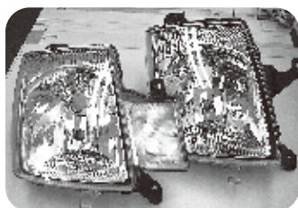
左側:ウインカー一体タイプ

ウインカー一体タイプ H16.4~H21.5 E・X・EII以外のグレード ~17/12 レバナシ 17/12~ レベ用 ウインカー別タイプ H18.12~H21.5 E・X・EII レベ用のみ