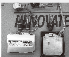
左 旧型 右 改良型

このディスチャージヘッドランプの心臓部であるHIDシステムはディスチャージバルブと点灯制御装置であるパラストで構成されていますが、旧型のディスチャージバルブには、ごく微量の水銀が含まれており環境面からもその使用廃止が求められました。現在ではバルブについては水銀代替物質の探索、バルブ形状の見直しを行い、パラストについては投入電力の最適化、高精度化を図ることにより水銀フリーでもヘッドランプに必要な瞬時に明るい光を発生させる技術を確認しました。又、回路動作の高周波化による部品の小型化に成功。従来の1/2の容積になりました。