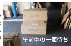
午前中の一便待ち

今年の初荷は、9連休にもかかわらず例年以上といった期待したほどの「お年玉」はなく、例年通りの淡々とした出荷状況でした。諸物価高騰の煽りから、車の遠出を控えた影響があったようです。