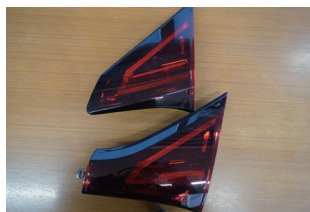
上段：前期 下段：後期