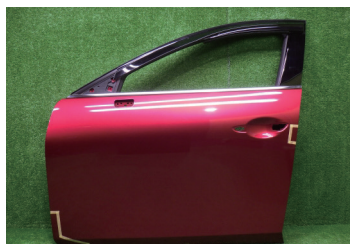
マツダ3 ファストバック(5D)