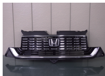
JH3 カスタム NA