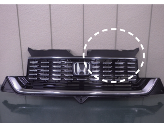
H3 カスタム ターボ