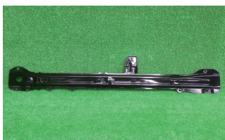
デイズ B21W 前期

デイズ B44W系、ルークス B44A系では、グレードに関係なく取付けステーが上下に1ヶ所増えました。