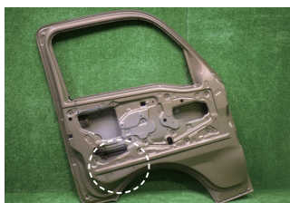
ドア裏 ポケット 取付穴2つ