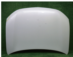
アウトランダー前期表

初期型 H25.1 ~ H27.1 中期以降 H27.1 ~ 裏面に□の大きな穴が追加 表面の見た目は同じですが、裏面に4角の大きな穴が開きました。