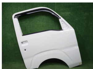
ハイゼットトラックS500P

内張りが付く部分の後方下部に2つ丸い穴が開いている物がドアポケット用(道具入れ)になります。