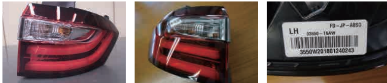
RC1 前期 メッキハウジング

前期 H25.10～H29.11 ウィンカーのインナー メッキハウジング 33500-T6A 後期 H29.11～ ウィンカーのインナー クロームハウジング 33500-T6AW