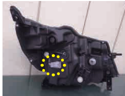
H30.5～カブラー色シルバー