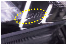
6040G ADB 装着ナシ