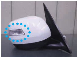
PR3 スタンダードメッキ