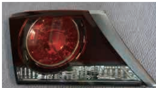
サランメッキ仕様

サランメッキ仕様 刻印 U 写真参照 標準 HV、NA車 // C ターボ車 // T