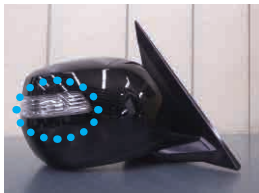
PR3 クールスピリットクロームメッキ