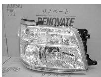
エルグランドE50 後期 キセノン ASSY 純価 104,000円