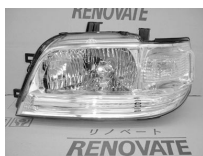
キューブZ10 後期 キセノン ASSY (ブルーでないもの) 純価 95,800円