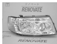
パスアラU30 前・後期共通 キセノン ASSY 純価 101,000円