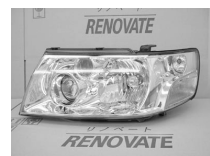
パスアラU30 前・後期共通 ノーマル ASSY 純価 26,300円