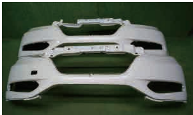
手前：前期キレコミなし 後：後期キレコミ有り