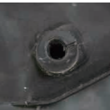
出荷する状況 (現状出荷)