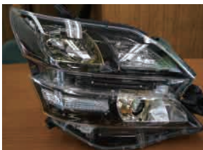
アルファード・ベルファイヤー

アルファード・ベルファイヤ (ANH20系) のライトで、グリル取り付け部はネジで固定しますが、事故を起こしていない車でも若干のヒビがあります。当社では今までその部分を補修していましたが、ヒビの状態でもネジで取り付け固定が可能な事がわかりましたので、今後は純正に近いヒビに関しては現状販売をさせて頂きます。(グリルを付けると見えません。)