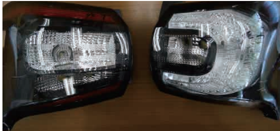
左側：LEDランプ仕様テール 右側：ハロゲンランプ仕様テール

標準仕様ではハロゲンランプですが、メーカーオプション仕様になるとLEDランプパッケージとなり、LEDライトの他にLEDテール、LEDフロントフォグの3点がセットで装着されます。