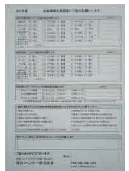
アンケート調査表

初めてリノベートパーツを活用されたお客様を対象にしたアンケート調査は、発送の都度おこなわれておりますが、今回の顧客満足度調査は長年ご愛顧頂いているお客様を対象におこなうもので、200件の有効回答を目標に実施致します。調査結果は、この紙面で発表しますのでご協力の程よろしくお願ひします。