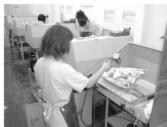
レンズ表面コーティング