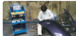
アルミパネルの钣金作業

5月に導入済みのミラクルアルミスタッドを使いこなして、アルミ製ボンネットを積極的に直しています。パテはアルミカーボンパテ：マジック930(ソーラー)を使用しております。