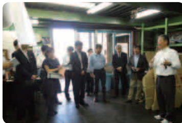
担当者 歓喜の瞬間

10月はリサイクル部品活用キャンペーン月間となっております。これに先がけて、9月19日、自動車用品業界5団体会員AAALのメンバー21名がリノベートパーツの生産工程を見学に来ました。参加されたほとんどの会員が、はじめてのリサイクル工場見学とあって、熱心に耳を傾けておりました。リサイクルパーツの活用促進に向けたキャンペーンにすこしはお役に立てられたものと思います。