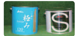
左：スチールパテ 右：アルミカーボンパテ