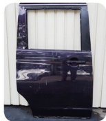
バレット・ルークス スライドドアー