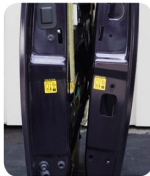
左側～24.4穴なし 右側24.4～穴有り