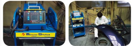
ミラクルアルミスタンド

今回導入したミラクルアルミスタンドは従来のものよりも、使いやすい点を評価して購入しました。今後は通常のボンネット同様に钣金作業をして出荷しますのでより使い勝手の良い商品となって皆様の元にお届け出来るものと考えています。