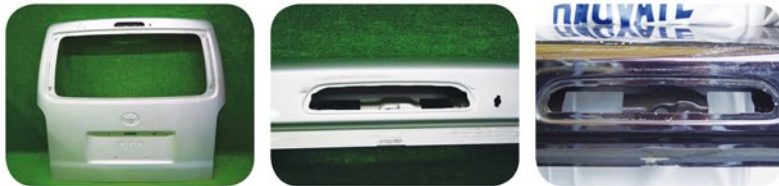
ハイエース～H24.5 ～H24.5 凸凹の切り込み形状が少ない H24.5～凸凹の切り込み形状が多い

～H24.5 切り抜かれた内側はわずかな凸凹ある。 H24.5～切り抜かれた内側は凸凹が並んでいる。