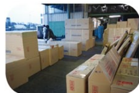
発送待ちのパーツ

これまで土曜日の当日出荷締切り時間はウイークデーと同様に PM2:00 になっておりましたが、運送会社の諸事情により2時間繰り上げて PM12:00 になりました。(平日はこれまで通り PM14:00 です。) ご迷惑をおかけしますがご協力お願い致します。