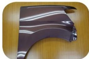
タントカスタム LA 600 S H25.10 ~

H25.10 発売されたタントカスタム LA600S のフェンダーが樹脂製になりました。これまでも新型エクストレル T32 の R ゲート、カラーフィルダー NZE161 の R ゲートなどが新たに樹脂製に変わっていますが、軽自動車に採用されるのは初めてです。燃費の過熱が引き金になってボディの軽量化に増々拍車がかかるものと予想されます。