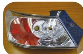
b B. QNC20H23.11 ~ キラメキ専用テール

テール内側の下に三角のレンズカットが入るタイプがキラメキ専用のテールになります。