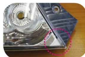
内側下キラメキ専用のレンズカットがある