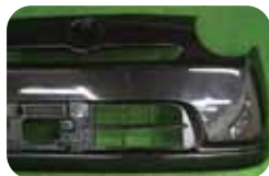
①メッキモールが付かないタイプ