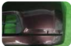
②H22.5~H24.4両サイドのメッキモール取付穴