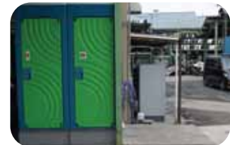
女性専用トイレの増設

常時、社内で作業しているスタッフ数は67名。その内女性スタッフは37名と全体の55%を占めています。女性スタッフによるきめの細かい仕事をモットーに、今後も増え続けるものと思います。高品質で安価なリノベータパーツを目ざして努力を重ねてゆきます。