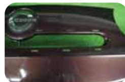
③H24.4~グリル回りのメッキモール取付穴