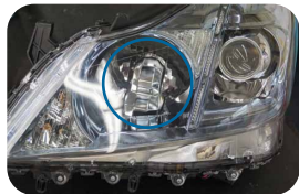
②ナイトビュー装着