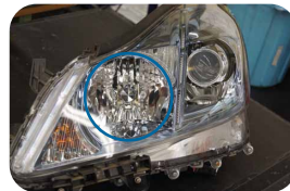
③ナイトビュー装着ナシ