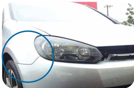
①ゴルフ、アーチ巾の違い