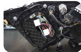
④下側コンピューター取付け穴