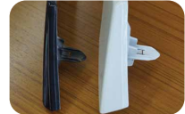
前期:右側 後期:左側