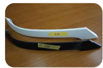
前期:手前 後期:後方