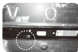
デラーオプション又は車外品の後と付け穴