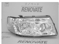
パスラU30 前・後期共通 キセノン ASSY 純価 101,000円