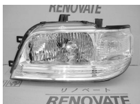
キューブZ10 後期 キセノン ASSY (ブルーでないもの) 純価 95,800円