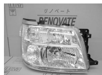
エルグランドE50 後期 キセノン ASSY 純価 104,000円