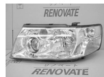
パスラU30 前・後期共通 ノーマル ASSY 純価 26,300円