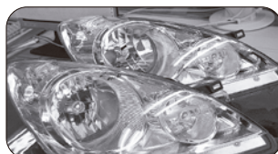
手前 H20/1~H22/11 奥 H22/11~