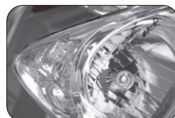
H20/1~H22/11 バルブ笠ありタイプ ポジションランプの回りは青色