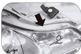
前期 18/11~19/11 上面全体がシルバー