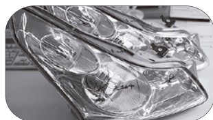
スカイラインV36セダン 外見は全く同一です。