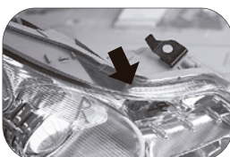
中期 19/11~22/1 上面の一部がクリアー