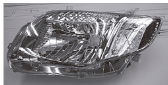
カラーフィルダー E141 ハロゲン