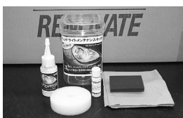
サンクスブライツセット 販売価格 6,090円（税込）