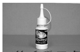
クリアコンパウンド 3,000円（税込）