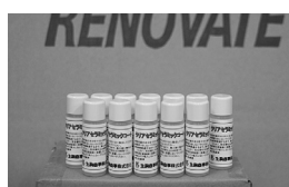
コーティング材 クリアセラミックコート 10g/本 3,000円（税込）