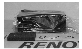
スポンジ 1袋20枚入り 1,500円（税込）