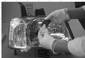
磨き残しのチェックと 最終清掃後セラミックコート塗布