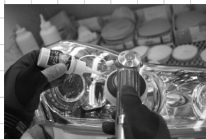
レンズ表面の清掃後 クリアコンパンドで表面研磨