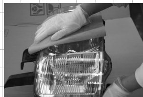
軽く乾拭きして完成