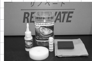
ライトメンテナンスキット ¥5800円/SET(税別送料込み)