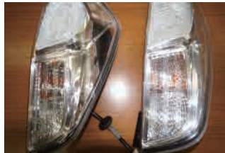
三菱 B11A と日産 B21A の共通テールランプ