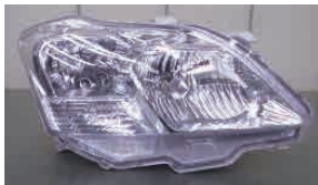
プレミオ ZRT260 系 HID ライト

見た目からの判断では違いが分かりませんので、レンズ NO と刻印の照合で年式を特定して下さい。小さい違いがあるはずですが、詳細は不明です。