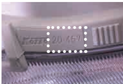
レンズ NO の位置