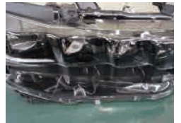
参考 プリウス PHV ZVW52

ヘッドライトの高機能化が進む中で、斬新なデザインのものが増え、最近ではレンズ面の凹凸のあるものも多く、溝の部分の磨きにはベテラン作業員もかなり苦戦しているところ。他社の追随を許さない品質を維持するため手間を惜しまず作業しています。