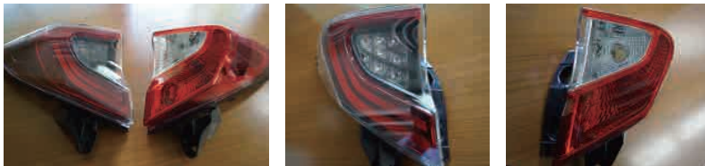
右: 通常タイプ 左: LEDランプセット仕様

通常タイプ : LED (ウインカー:パルプ) ライン形状発光無し LEDランプセット : LED (ウインカー:LED) ライン形状発光するタイプ