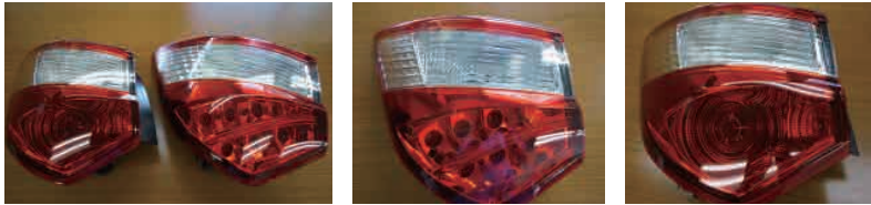
右: LEDランプセット仕様 左: 通常タイプ

通常タイプ : LED 1個発光 (ライン発光無し) LEDランプセット : LED 6個発光 (ライン発光するタイプ)