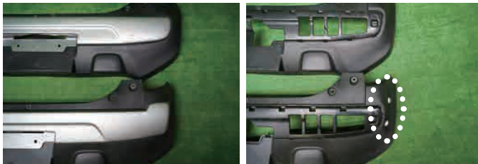
ガーニッシュの形状 上段 標準タイプ 下段 JスタイルII

H26.1 ~の標準グレードに対してH27.12 ~に「JスタイルII」のグレードが追加されました。形状の違う少し大きいガーニッシュになり、バンパーもそれに合せて取付の穴が増えました。