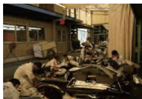
ライト類検品作業