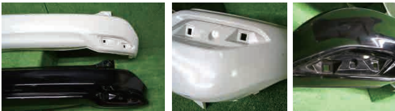
上段 白色：標準タイプ 下段 黒色：RS

H25.12 ~の標準グレードに対してH28.2 ~グレードRSが追加されました。リフレクター廻りの形状がエアロっぽくなっているのが特徴です。