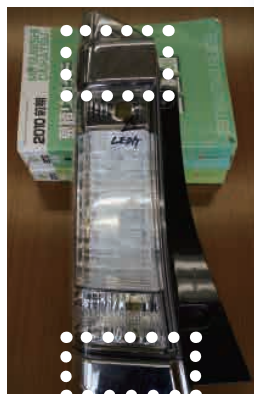
③上下共にメッキ仕上 H26.12 ~