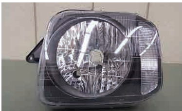
ジムニー前期 かさなしタイプ

前期 H17.10 ~ H26.8 レベライザー付 かさなし 100-32647 後期 H26.8 ~ レベライザー付 かさ付き 100-32081