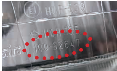
ジムニー前期 レンズ番号