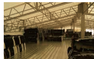
新設されたバンパーの保管スペース

現在入荷しているコアの半分は 5 年～ 6 年の在庫期間を経て、販売チャンスが訪れるもので、将来の需要拡大を満すには、在庫スペースの整備・拡張を先行させる必要があります。前月完成したバンパーの保管ヤードはすでにほぼ半分のコアが埋ってしまいました。今後、品質を重視した需要が更に高まる事も予想され、一層の保管環境の充実が求められています。9 月に確保した隣地は現在駐車場として使用していますが、来年度以降は保管スペースとしての活用を計画しています。