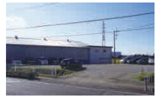
予定される保管ヤード