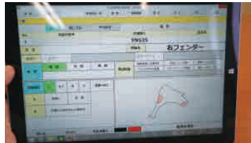
钣金課用タブレットのチェックシート

5 月よりスタートした第四次ソフト開発が 11 月 18 日に完成、試験運用に入りました。本格運用は来春早々の予定です。このシステムの完成で現在 7500 点前後の出品数を一気に 10,000 台に引き上げる目算を立てています。リノベートパーツをたくさんのユーザーに活用して頂けるように情報公開を進めてゆきますので、ご期待下さい。