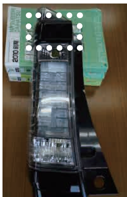
②上部ブラック仕上 H25.12 ~