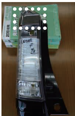
①上部メッキ仕上 H23.12 ~