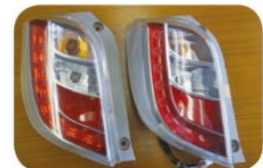
右側は初期タイプ 左側は中期タイプ