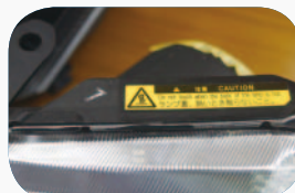
H24.5～ エアロツアラー刻印「1」 内部スモーク色