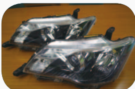
手前が普通のエアロツアラー「1」 後方がダブルバイビー「2」

カラーフィールダー NZE61 エアロツアラーに 2 つのアイテム！ H24.5～普通のエアロツアラー刻印「1」内部スモーク色 H24.12～エアロツアラー・ダブルバイビー刻印「2」内部ダークスモーク色 簡単な見分け方は刻印での判断が確実です。