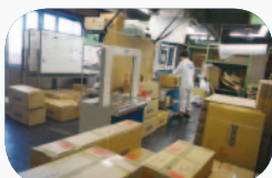
汎用自動梱包機 AL801 日本包装機械(株) 定価 715,000 円

ヘッドライト・テール・グリル・ミラーなどの小物の困包が増え、PP ベットを掛ける手間がかなりの負担になり自動梱包機の導入に踏み切りました。ちょうどパート社員の欠員が出ているさなかで、人員不足を解消する以上の効果をハッキリしています。