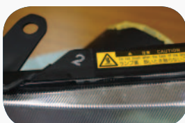
H24.12～ エアロツアラー・ダブルバイビー刻 印「2」 内部ダークスモーク色