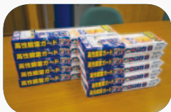
落雷ガードコンセント

電話回線の落雷対策では NTT さんに万全の対応をお願いしました。電源側の対策は落雷ガードコンセントにすべて切り換え被害の拡大を防ぐバリアを張り巡らしました。専門家に言わせると「気休め程度の対策かもしれませんが、無防備よりも良いでしょう」といったものらしく、落雷がもたらす誘導雷サージの威力がいかに強力か！新ためて落雷の恐ろしさを実感しております。