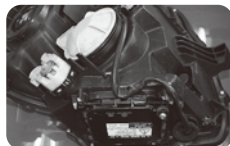
参照① ヴォクシー前期 HID用

ユニットのヘッドライトにバラストをセットする場合、以前はバラストの取付け位置とバルブのフタの位置が離れていたため、参照①配線を通す為に光軸調整ネジをぎりぎりまで緩めヘッドを通しておりました。この時に光軸調整ネジを緩めすぎたりして外してしまうアクシデントが多発しておりました。ヴォクシーZRR70系の前期タイプ(19/6~22/4)は従来の構造でしたが後期タイプ(22.4~)になってバルブのフタの上にバラストが付くタイプ参照②に改良され光軸調整ネジをいじらずに簡単にセッティング出来る様になりました。参照③HID(ディスチャージ)とハロゲンの違いはバルブのフタを見れば一目瞭然と判別がつく様になりました。