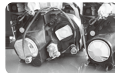
参照③ ヴォクシー後期 左: HID用 右: ハロゲン用