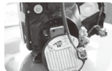
参照② ヴォクシー後期 HID用