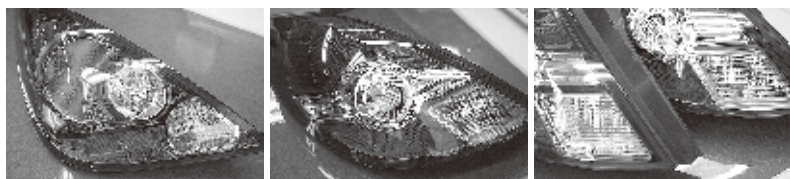
前期: (16/9~20/1) 後期タイプ① (20/1~21/11) バックランプのレンズ色 右側ピンク:後期① 左側 無色:後期②

前期 (16/9~20/1) と後期 (20/1~) では全くデザインが違いますが、後期タイプは ① (20/1~21/11) と後期② (21/11~) のものと2つに区分されます。違いはバックランプのレンズ色がピンク:① 無色:②だけです。レンズNo.は共通になりますのでご注意ください。