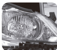
クラウン ハイブリッド GWS204 ナイトビュー無し