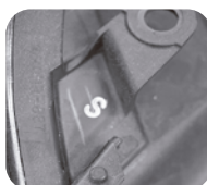
後期タイプ マークS