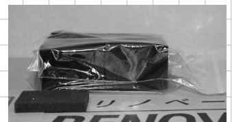
スポンジ 1袋 20枚入り 1,500 円 (税込)