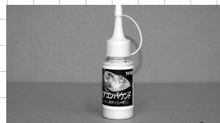
クリアコンパウンド 3,000 円 (税込)