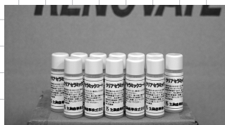
コーティング材 クリアセラミックコート 10g/本 3,000 円 (税込)