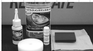
サンクスブライセット 販売価格 6,090 円 (税込)