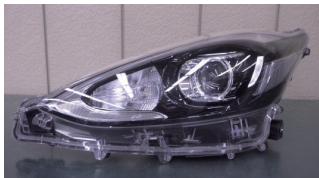
スタンダード系専用