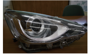
アクア NHP10 中期 ASSY

LEDヘッドライトの普及で入荷数も増し、アイテムによっては、一定以上の在庫量に達したことを機に、キャンペーン価格を設定することになりました。対象はトヨタ系を中心に43アイテムです。同時にバンパー・フード・フェンダー類のアイテム追加で「新春拡大キャンペーン」は全114アイテム数の追加規模になりました。今後も年2回の拡大キャンペーンを予定いたしますのでご期待ください。