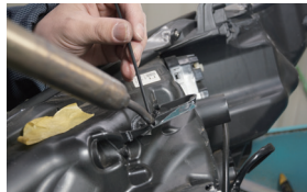
充てん材を溶かし込む