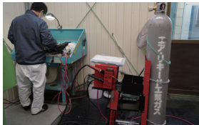
窒素プラスチック溶接機

窒素溶接は、樹脂パーツの修理に広く使用され、最近では樹脂フェンダー、樹脂バックドアの修復にも活用されています。この熱可塑性プラスチックの溶着プロセスをヘッドライトのステーの修復に利用できないか？3日間の実証作業を予定しました。リノベートパーツのユーザーは、ステーを修復した痕跡を最小限に抑え、かつ強度が期待できる修復を望んでいます。こうした顧客ニーズを満たした補修が可能か？実証作業後はメーカーとのミーティングも予定されています。