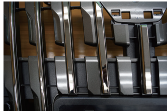
ブラックテールード：スモークメッキ加工