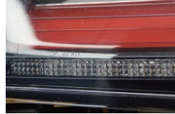
シーケンシャル付きタイプ