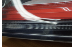
シーケンシャル無しタイプ