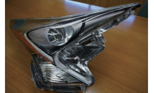
プリウス ZVW50 前期ユニット