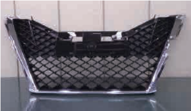
グリル枠がメッキ 後期・標準タイプ

後期 H27.10～H30.6 標準タイプ(メッキ) 特別車 H29.8～H30.6 J-フロンティアリミテッドタイプ(漆黒メッキ加飾) 形状は同一ですが、メッキ部分の色が違います