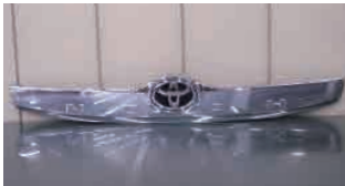
前期 STD メッキタイプ

前期 H26.1～H29.7 メッキタイプ STD (WXBとG'Sは除く) 前期途中 H28.4～H29.7 スモークメッキ WXB、G'Sのみ