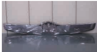
前期途中～ WXB、G'S スモークメッキ