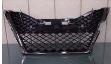
グリル枠が漆黒メッキ 後期・J-フロンティアリミテッドタイプ