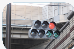
信号機表示の改善

事故が多発している交差点での信号機表示の整備が進み、写真の様な右折専用表示が追加され直進車両と右折車両の衝突事故回避に大変な結果を發揮しているようです。