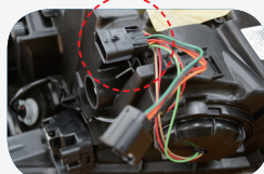
H 24.11 ~ LEDタイプの コネクター形状