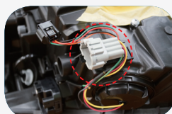
H 22.12 ~ LEDタイプの コネクター形状